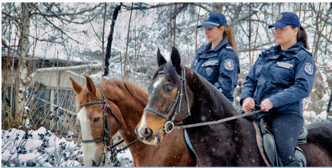
Служителки от група „Конна полиция“ към отдел „Специализирани полицейски сили“ – СДВР