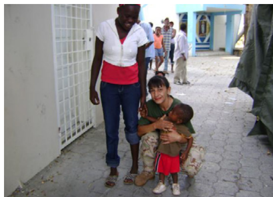
Български медицински екип след земетресението в Хаити, фотограф: СЖВ /личен архив/