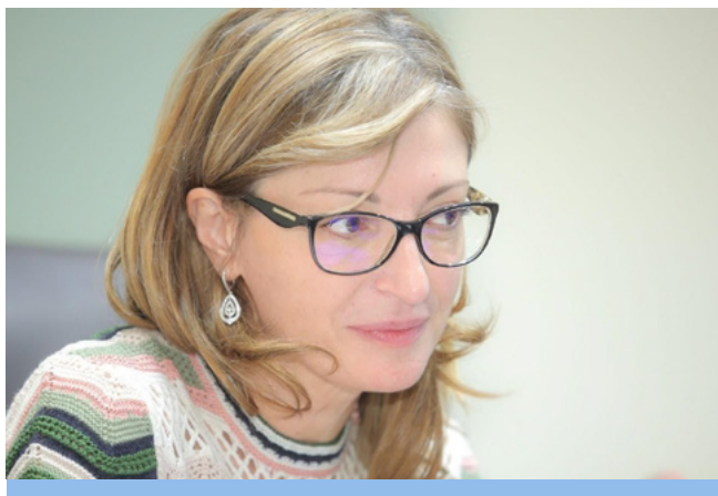
Екатерина Захаријева, заместник министър-председател по правосъдната реформа и министър на външните работи на Република България