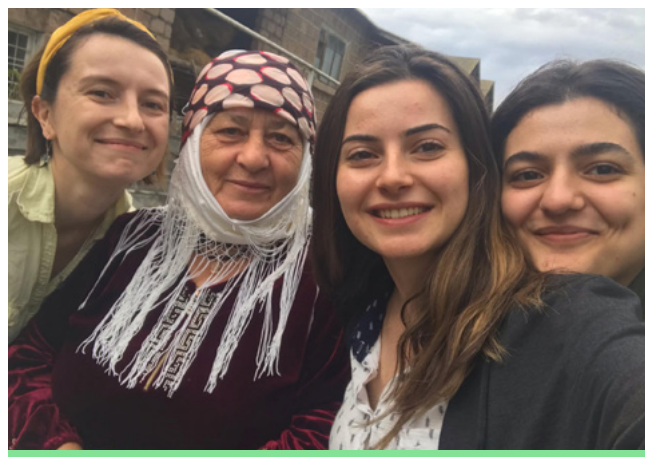
Eurasia Partnership Foundation (EPF) в изпълнение на проект в Армения за подпомагане на жени-язиди – жертви на конфликт (финансиран с българска ОПР)