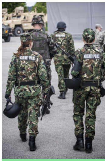
Смесен екип от Служба „Военна полиция“