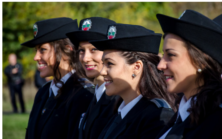
Курсанти от Академията на МВР