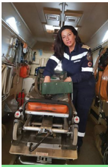
Служител на ГД „Пожарна безопасност и защита на населението“