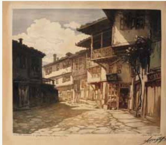
Petar Morozov. Village Houses in Gabrovo. 1937, aquatint