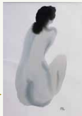
▶ Dechko Ouzunov. Nude. 1950s, aquarelle