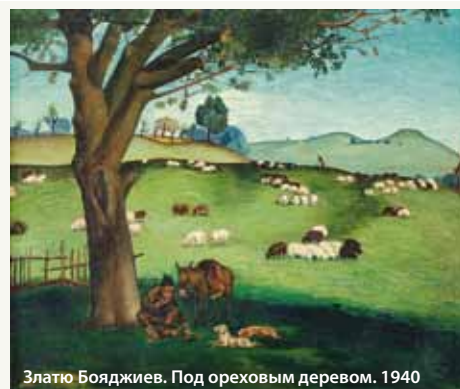
Златю Бояджиев. Под ореховым деревом. 1940

Иллюстрации являются копиями картин из фонда Государственного культурного института МИД Болгарии