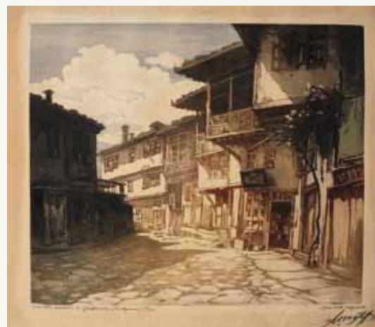
Петар Морозов. Сельские дома в Габрово, 1937, акватинта