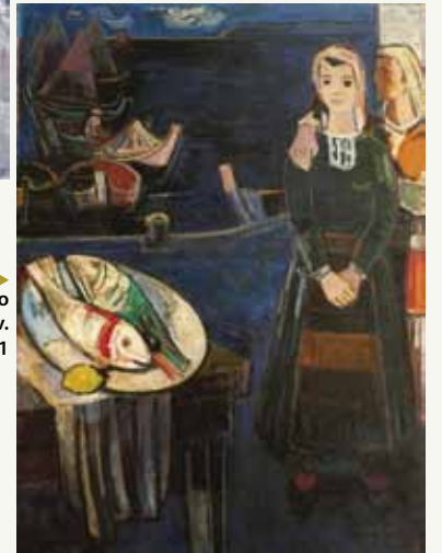
▶ Bencho Obreshkov. Port. 1961