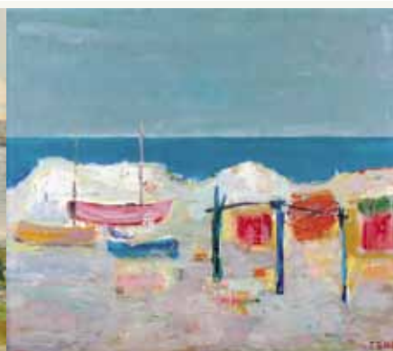
Георгий Баев. Море. 1970