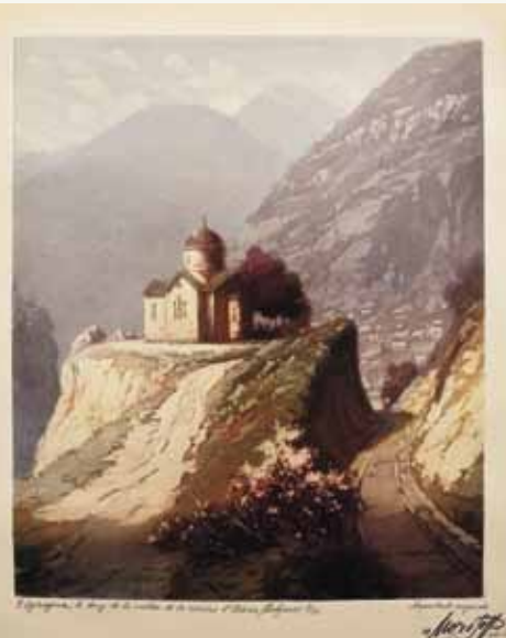
▼ Petar Morozov. Eliseyna. 1936, aquatint