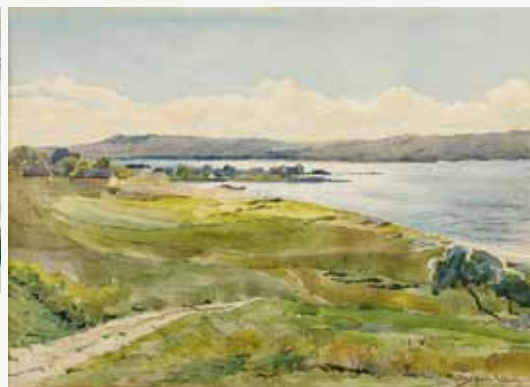
Konstantin Shturkelov. Varna shore, aquarelle