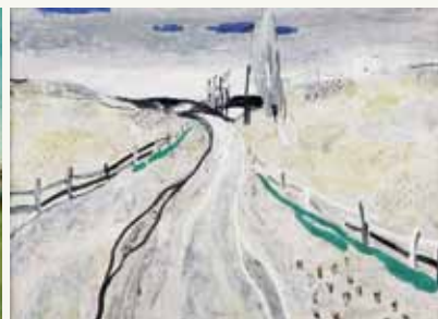
▲ Svetlin Roussev. Landscape. 2005