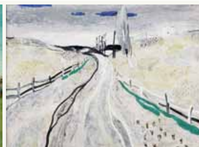
Светлин Руссев. Пейзаж, 2005